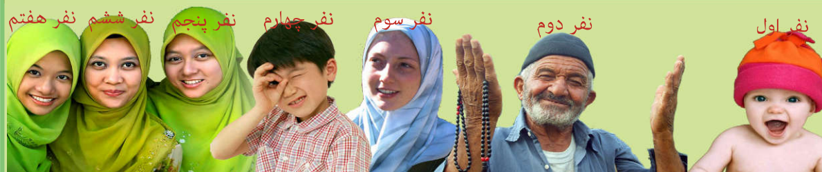
نفر ششم نفر هفتم

پ) تاریخ تولد این افراد را حدس بزنید؟ به نظر من، نفر اول متولد سال