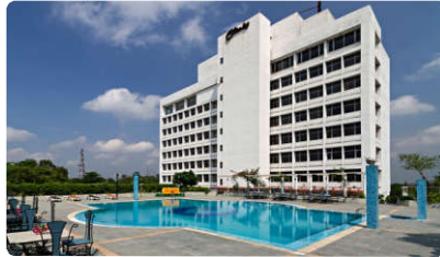
هتلش خیلی خوب / قشنگ بود.