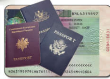
پاسپورت / ویزا