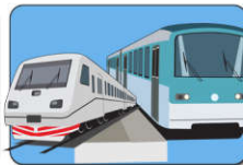
قطار عادی قطار سریع السیر