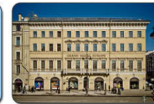
هتل / مسافر خانه