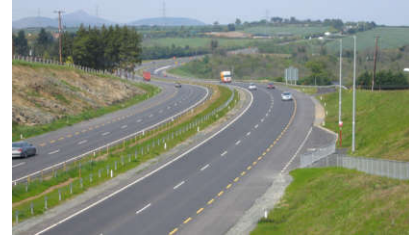
جاده خلوت بود.

دیدنی / لذت بخش / بسیار زیبا / جالب بود.