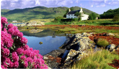
هوا خنک / بهاری بود.