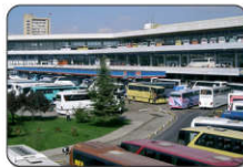
ایستگاه / ترمینال