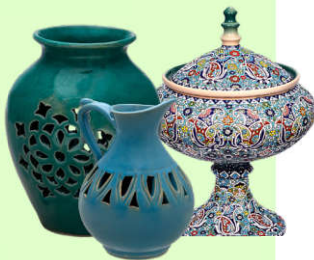
سفال و سرامیک